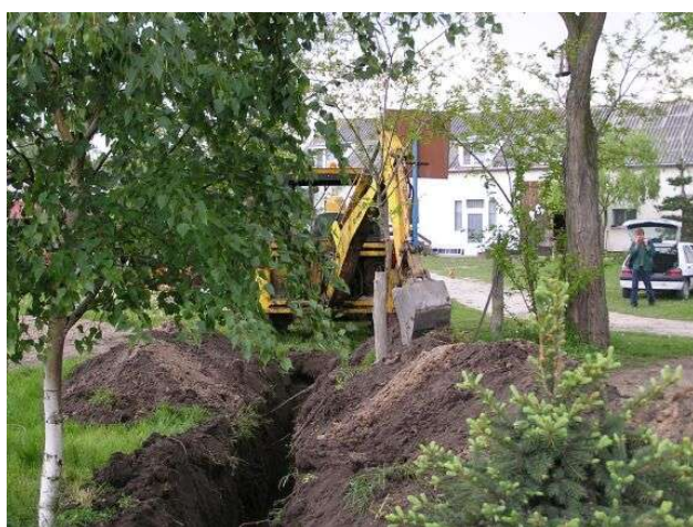
Przyłacza w miejscowości Połajewek

W tym zakresie wybudowano nitkę wodociągową w m. Połajewek i Przedłuż o łącznej długości 2771 mb. Aktualnie trwa podłączanie gospodarstw domowych do wybudowanego wodociągu. Koszt tej inwestycji zamknie się w kwocie 137,620 zł. Planowany termin zakończenia inwestycji to 31 lipiec 2004 roku.