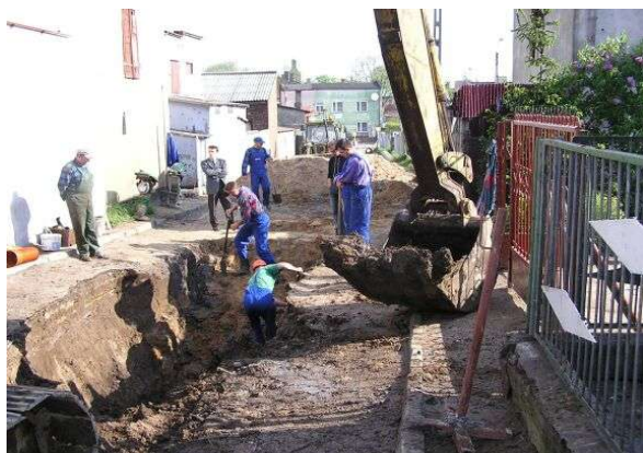
Prace budowlane na ulicy Kościuszki.

W tym temacie rozpoczęliśmy budowę kanalizacji sanitarnej wraz z podłączeniem gospodarstw domowych o łącznej długości 6026 mb. ulic: Kościuszki – Łąkowa – Dolna – Kaliska i Sportowa. Przewidywany koszt tej inwestycji wyniesie około 273 tys. euro. Zadanie to zostanie zakończone w początkach IV kwartału 2004 roku.